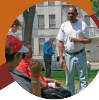
Reunión sobre la reurbanización del Westside en Lincoln Park, verano de 2007