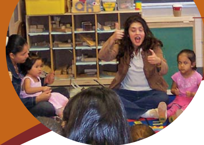
Maestra, padres y niños en la escuela primaria Harrington del barrio Cole, otoño de 2007

Ascensos en el trabajo, acumulación de bienes y redes sociales. Junto con Mile High United Way, Haciendo Conexiones en Denver está ayudando a las familias que trabajan para la ciudad y para Denver Health a recibir la capacitación y educación necesarias para presentarse a puestos de trabajo mejor remunerados y poder ser ascendidos en el trabajo. Hemos aumentado nuestros esfuerzos para vincular a los residentes a oportunidades para reparar su historial de crédito y ahorrar más dinero. Dado que las redes sociales ayudan a todas las familias a encontrar trabajo, Haciendo Conexiones en Denver se ha unido a la Fundación Piton y a otros grupos con el fin de ayudar a los residentes a “formar redes” en su búsqueda de un trabajo estable.